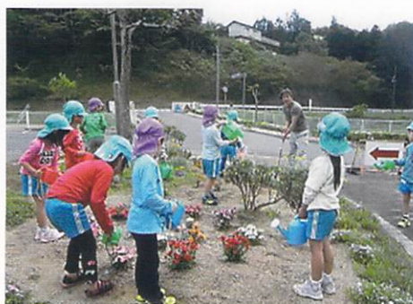
春期緑化運動(津市 白山こども園)