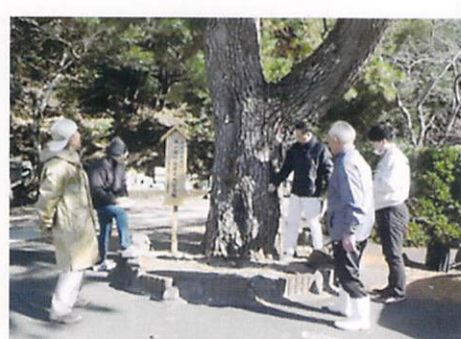
樹木健康診断(南伊勢町 方座浦)