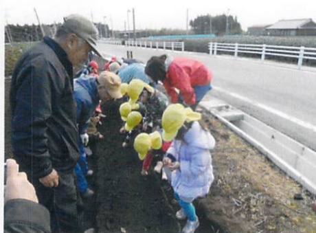
緑の募金交付事業(鈴鹿市 椿地区まちづくり協議会)