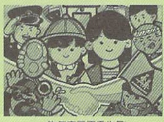
（昨年度最優秀作品）

応募のきまり 応募作品の裏面に、住所、氏名（フリガナ）、年齢、電話番号、職業又は学校名、学年を明記して下さい。