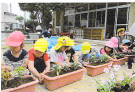
志摩市 志島保育所 春期緑化運動