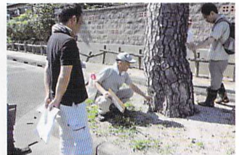
津市香良洲町 香良洲公園 松の健康診断