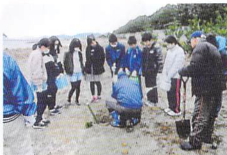
伊勢市 大湊町振興会 海岸への松の植栽